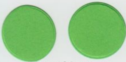
ogen mfd 55-11